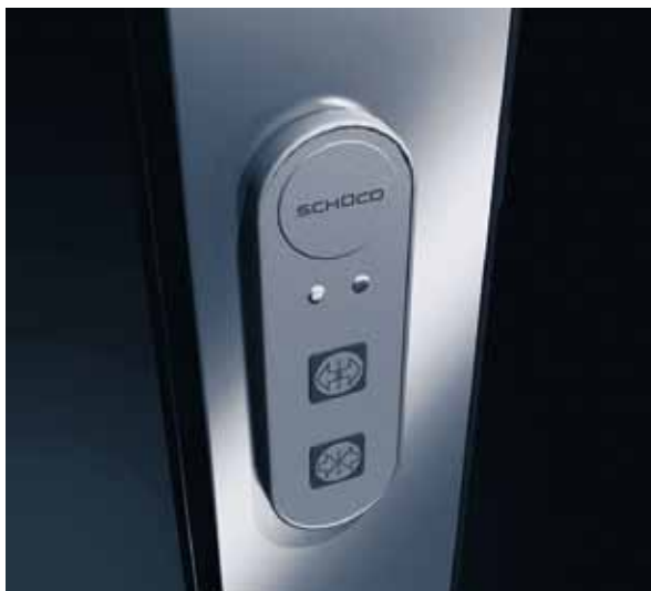
Enkel betjening Tryk på en knap