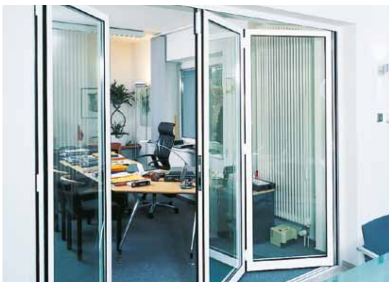
Uisoleret foldedør Til indvendig brug