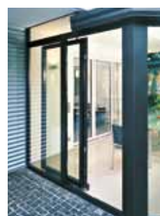
I åben stilling