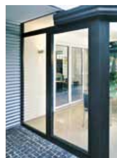
I lukket stilling