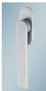
Greb til foldedør