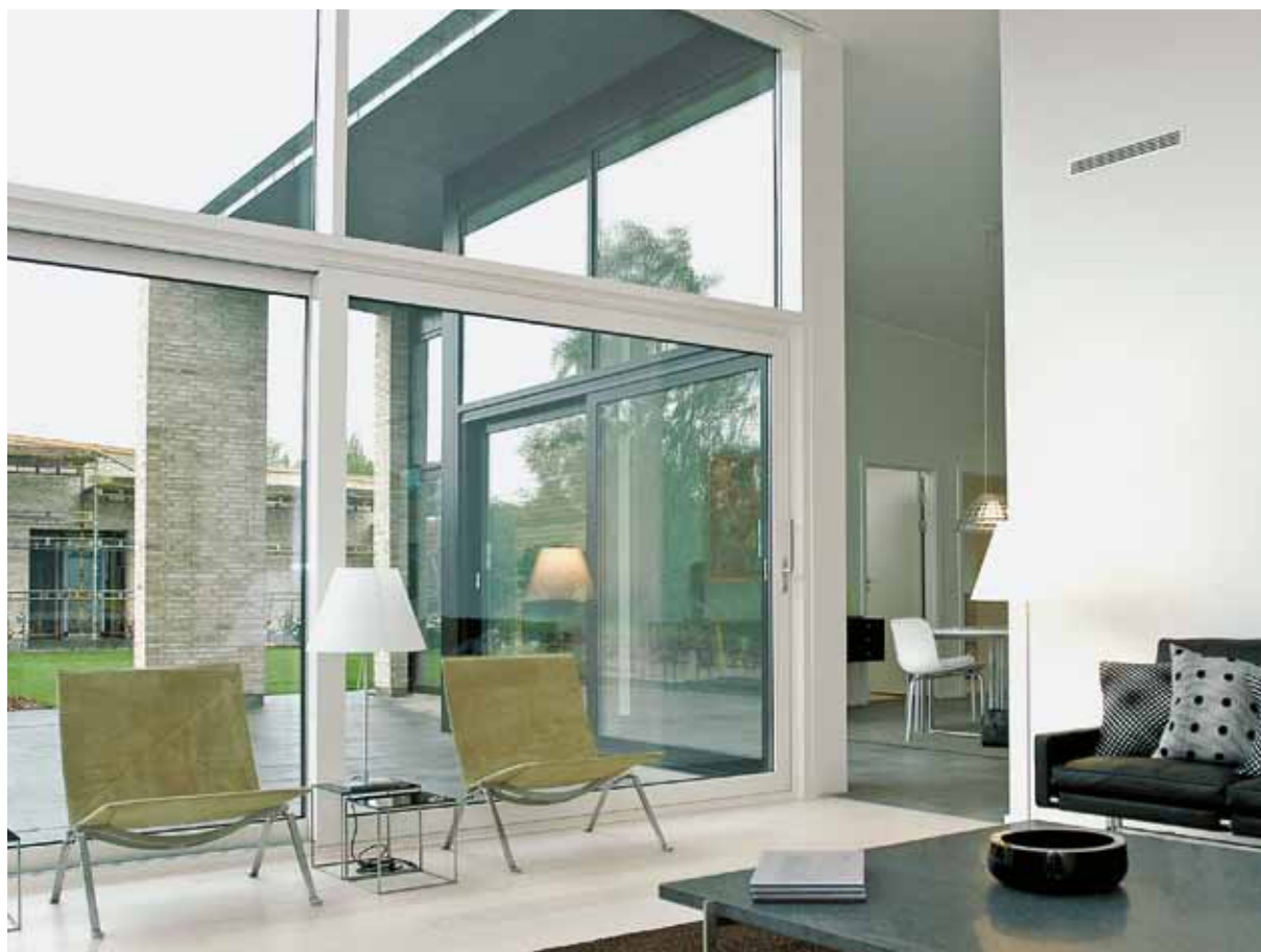
Øget komfort med hæve-skydedøre

En hæve-skydedør gør betjeningen ekstra nem. I lukket position har den en god tæthed og giver således både en udmærket indbrudssikring og god lyd- og varmeisolering. Åbningsvarianterne er enten fra siden eller fra midten. Der kan monteres op til tre løbeskiner, så det bliver muligt at åbne hele 2/3 af elementet.