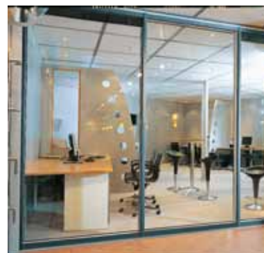
Som rumdeler i et kontorlandskab

For størrelser og vægt se systemoversigten på side 14.