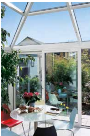
Udestue med hæve-skydedør