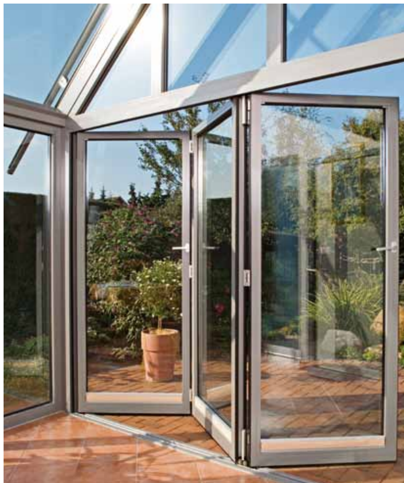
Isoleret foldedør Til brug i ydervægge

For størrelser og vægt se systemoversigten på side 14.