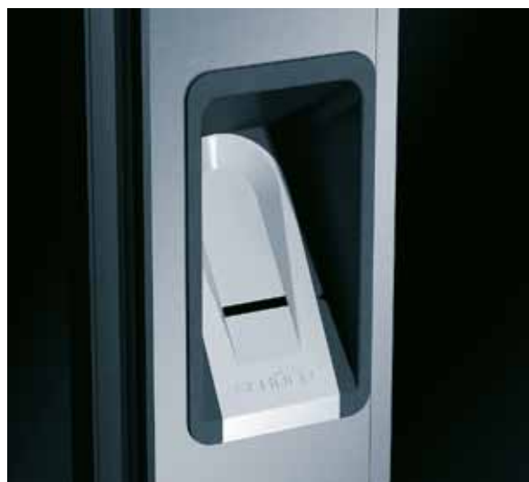
Fingeraftryklæser For sikker adgangskontrol ved indvendige døre