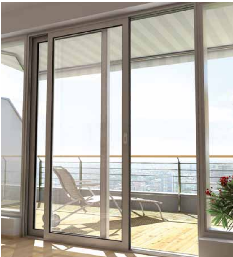
Stilren design Kombineret med intelligent teknik

Der kan opnås en sikker adgangskontrol ved at integrere en fingeraftryklæser i dørkarmen. Døren åbnes ved at føre fingeren hen over den termiske aflæserstribe. Den kan selvfølgelig kun betjenes af den eller de personer, der på forhånd har fået lagret deres fingeraftryk i læsersystemet.