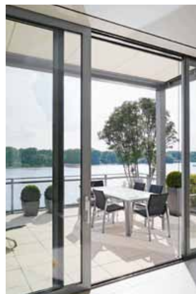
Lejlighed med god udsigt